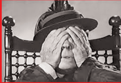
Traumflimmern mit dem GODOTrio